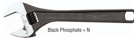
Black Phosphate = N