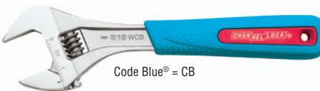
Code Blue® = CB