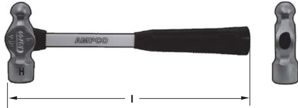
Hammer, Ball Peen Marteau d'ajusteur, emmanché, type américain Martillo de Ingeniero with Fiberglass Handle

Los mangos pueden comprarse por separado.